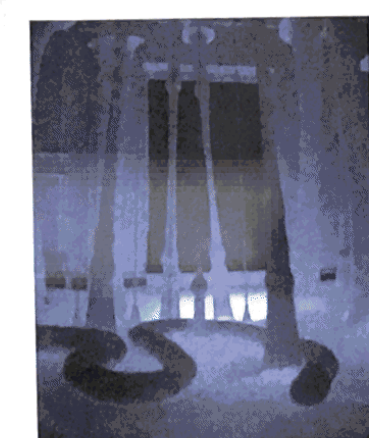
Mehkoben arhitekturni ambient

Reality), pri čemer se s prepletanjem dveh resničnosti oblikujejo novi medijski svetovi kot novi univerzumi. V ospredju so predvsem teoretična dognanja sodobne fizike o tem, da naš svet ni tako stabilen kot si radi zamišljamo, ter psihologov R. A. Wilsona in T. Learyja o vzajemnem delovanju in vplivanju človeka ter okolja. Z umetniškimi deli se tako izpostavlja koncept irealnega, ki izziva napetost oziroma neravnotežje med otipljivo resničnostjo in imaginarnimi svetovi.