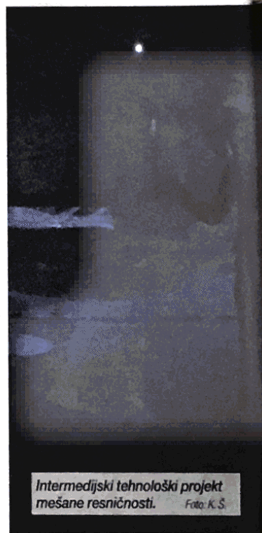
Intermedijski tehnološki projekt mešane resničnosti.

TRG (Transient Reality Generators) oziroma generatorji prehodne resničnosti je projekt ustvarjanja interaktivnega ambienta, kjer naša fizična resničnost prehaja v virtualno. Vstop v medijske svetove udeležencu