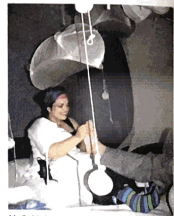
Nožni jakuzi, masaža in branje z nog